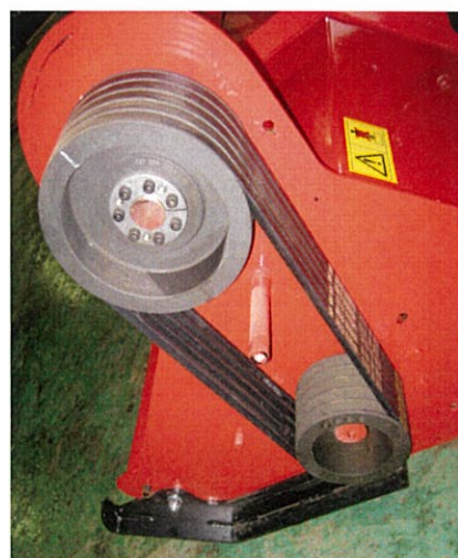
ベルト駆動トランスミッション